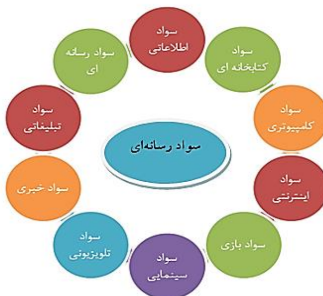
شکل شماره ۱: اکولوژی سواد رسانه‌ای؛ مفاهیم سواد رسانه‌ای (یاترو، ۱۳۸۵)

رسانه‌ها و خصوصاً اینترنت، حتی کودکان نیز قادر خواهند بود، در دنیایشان خودمختاری بیشتری داشته باشند. به‌علاوه معلمان و استادانی که مهارت‌های سواد رسانه‌ای را کسب می‌کنند، می‌توانند به اشاعه دهندگان اطلاعاتی تأثیرگذارتری تبدیل شوند و فاصله میان برنامه‌های آموزشی و برنامه‌های اجتماعی را از میان بردارند (دان، ۲۰۰۳).