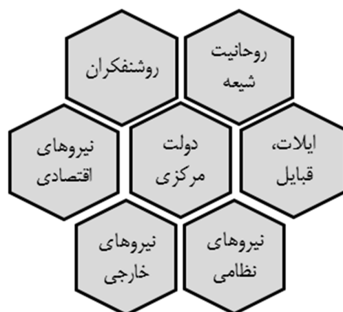
شکل ۱. پراکندگی منابع قدرت اجتماعی و روابط موازی میان آن‌ها

تاکنون پراکندگی منابع قدرت اجتماعی داخلی و خارجی مورد بررسی قرار گرفت. منابع قدرت در جامعه ایران دوره قاجار به‌صورت موازی و شناور در کنار همدیگر قرار داشتند که فضای خالی میان خانه‌های شکل (۲) حاکی از همین نکته است. موازی و شناور به این معنی که هر لحظه این امکان وجود داشت که در اثر تحول روابط نیروهای اجتماعی، دولت با چالش و بحران‌های بیشتری مواجه شود یا در وضعیت بهتری قرار گیرد. در ادامه با معرفی ساختار دولت درمانده که برآمده از روابط نیروهای اجتماعی است، نهایتاً مدل تئوریک ساختار دولت و روابط خارجی در دوره قاجار ارائه خواهد شد.