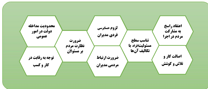
شکل ۳. نگرش‌ها و دیدگاه‌های کلان مدیریتی آیت‌الله مهدوی کنی (علیه السلام)