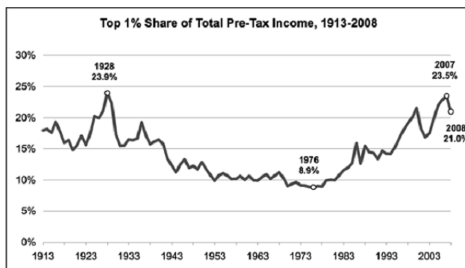
نمودار شماره ۲. حداکثر سهم یک درصدی درآمدهای قبل از مالیات (نادری، ۱۳۹۱، ص ۱۱۶)

احتکار و حرص و طمع مدیرانش به آستانه سقوط رسید. همان‌هایی که بعد با پول مالیات‌دهندگان نجات پیدا کردند اما عادت دریافت پاداش‌های میلیونی را برای عملکرد ناشیانه‌شان فراموش نکردند. شرکت‌های مالی باقی‌مانده وام‌دهی را قطع کردند و بنابراین هزاران شرکت تعطیل شد، میلیون‌ها شغل از بین رفت و دستمزدها ناگهانی کاهش یافت. هیچ‌کس پاسخ‌گو نبود. هر دو حزب اصلی کشور، نجات نظام مالی را اولویت خود قرار دادند (کاستلز، ۱۳۹۳، ص ۱۳۶).